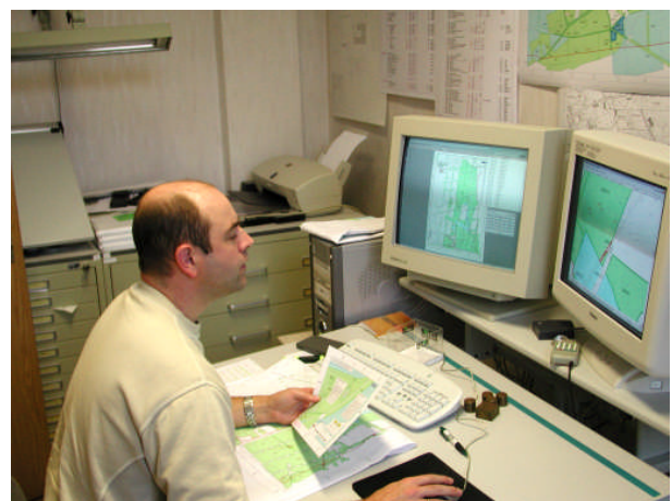
Erstellung von Gutachten